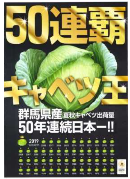
50年連続日本一記念ポスター