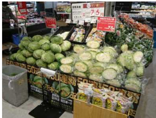
キャベツ売り場の様子

また、夏秋キャベツについては、農林水産省が調査する野菜生産出荷統計において、夏秋キャベツ出荷量で群馬県が50年連続日本一という偉業が達成されました。今回のフェアでは、50年連続日本一を記念したポスターやポップが作成され、各店舗の売り場でPRに活用されました。